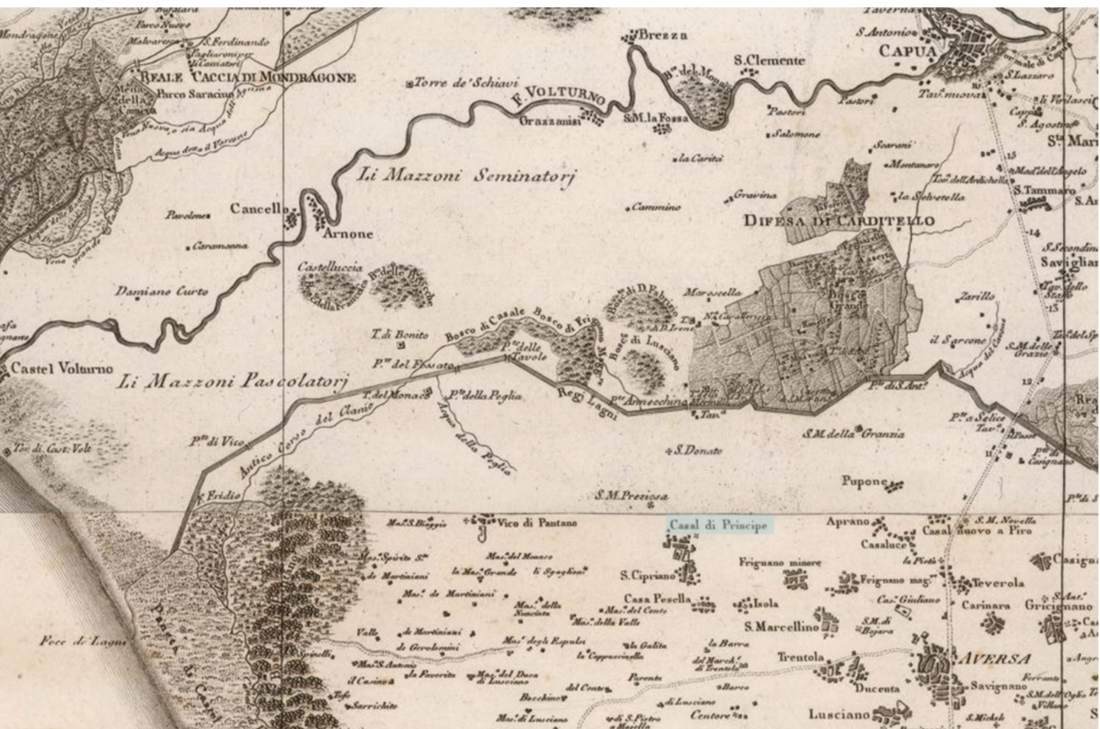
[1808] Atlante geografico del Regno di Napoli, Rizzi Zannoni