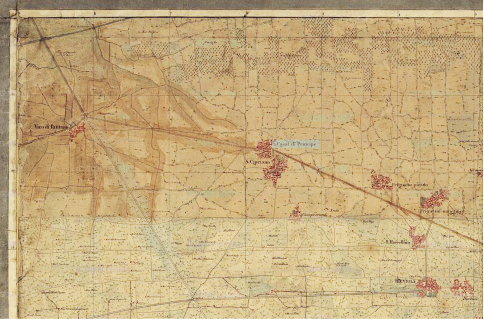
[1836-1840] Carta dei dintorni di Napoli, Ufficio Topografico ex Regno di Napoli