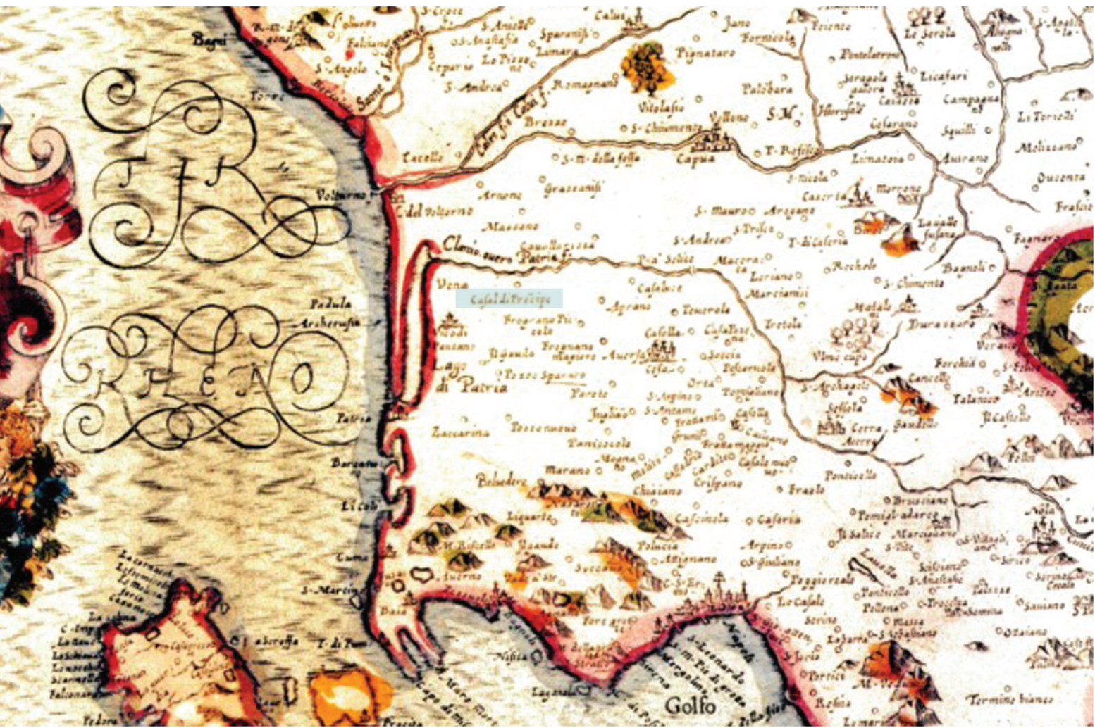
[1620] Terra di Lavoro Olim Campania Felix, Giovanni Antonio Magini