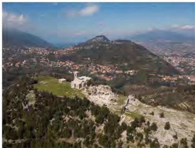
(Castello di Piro - Pimonte)

COMUNE DI PIMONTE Città Metropolitana di Napoli